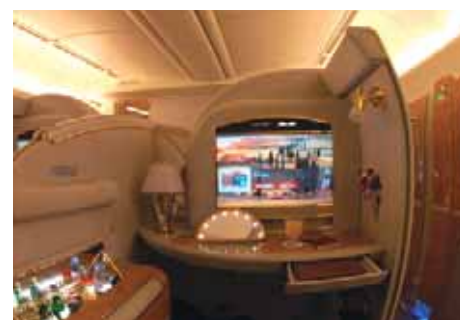
Prva klasa u Boeingu 777-200LR Emirata

Philippe Chérèque Amadeusov potpredsednik za komercijalna pitanja, istakao je da će ulazak Emirata u sistem u velikoj meri pomoći agencijama da ponude klijentima veći izbor letova, posebno u regionima Evrope, Bliskog istoka i Pacifičkog dela Azije.