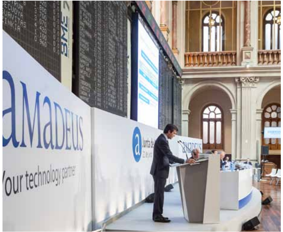
Junta General de Accionistas de Amadeus 2012

► Además de la comunidad de inversores, el departamento de Relaciones con Inversores mantuvo más de 112 reuniones con analistas de diferentes intermediarios financieros, algunos de los cuales estaban comenzando el seguimiento de la compañía. Como resultado, el número de analistas que siguen Amadeus aumentó hasta los 34 al final del año, desde los 29 en diciembre de 2011.