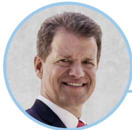
Dr. Roland Busch Consejero

Se incorporó al Consejo de Administración en calidad de Consejero Ejecutivo el 26 de junio de 2014 y fue nombrado Consejero Delegado el 16 de octubre de 2014.