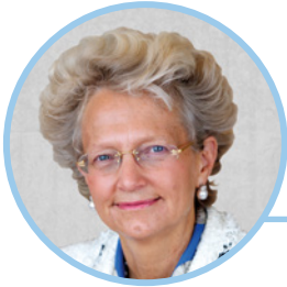
Dame Clara Furse Consejera

Dame Clara Furse es Presidenta designada de HSBC UK. Cesó en el cargo en la Comisión de Política Financiera del Banco de Inglaterra (FPC) en octubre de 2016. Es también Consejera externa de Nomura Holdings Inc., Vodafone Group plc y del Departamento del Reino Unido para Trabajo y Pensiones, donde es consejera coordinadora independiente. Es miembro del Panel of Senior Advisors de la Chatham House, miembro del Consejo asesor internacional de la Universidad de Bocconi y presidió la Jefatura del Grupo de Expertos de la Oficina del Gobierno del Reino Unido para el Science Foresight Project sobre el futuro de la negociación informática en los mercados financieros en 2012.