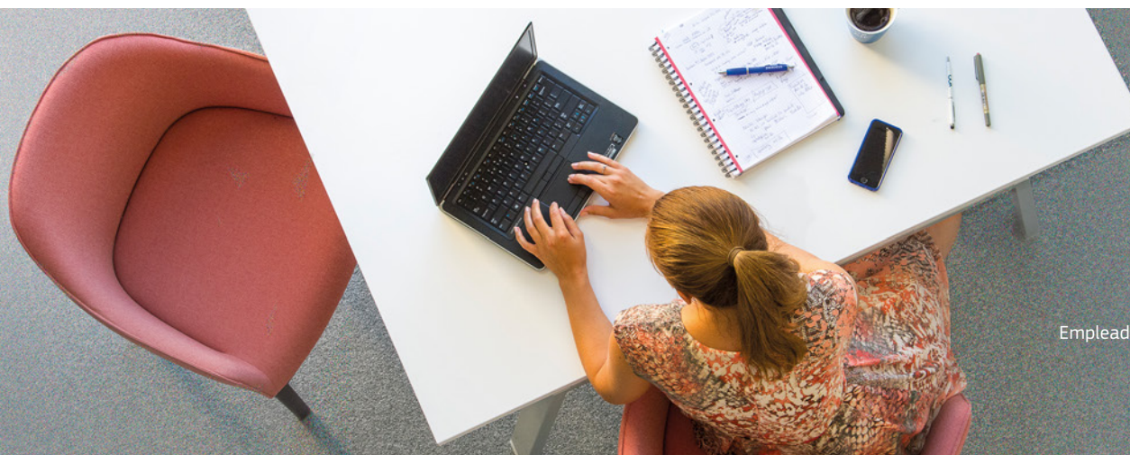
Empleada de Amadeus en el edificio Bel Air en Niza.

Los flujos de coordinación establecidos entre la Auditoría Interna del Grupo y las unidades principales de control, líneas de negocio y tecnología garantizan un complemento continuo y óptimo de las actividades de control independientes y objetivas de la Auditoría Interna.