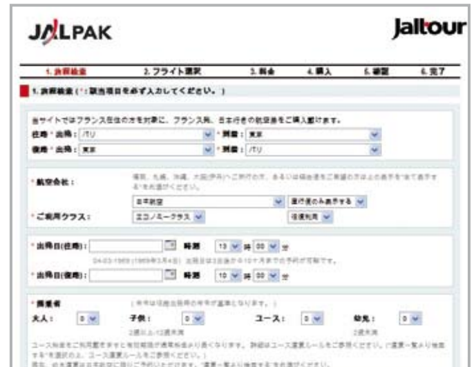
Page d'accueil du site e-Commerce Jaltour

Président, JALPAK International (France) S.A.S.