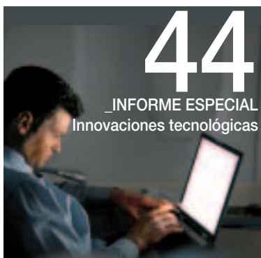
44 _INFORME ESPECIAL Innovaciones tecnológicas

La revista SAVIA es una publicación de Amadeus España. La empresa no se identifica necesariamente con el contenido de los artículos ni con las opiniones de sus colaboradores. Queda prohibida la reproducción total o parcial sin la autorización previa de la empresa editora.