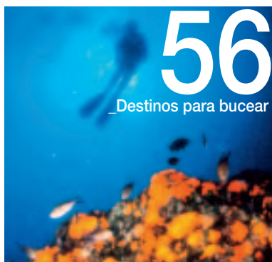
56 _Destinos para bucear