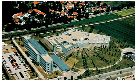
Centro de Amadeus en Erding.

Alrededor de 500 líneas aéreas y 95.000 agencias de viajes dependen de esta base tecnológica, en la que se procesan tres millones de reservas y 500 millones de transacciones cada día. De hecho, en un solo segundo, el centro de Erding registra más datos que la misma bolsa de Nueva York. Las capacidades tecnológicas del centro de datos de Amadeus en Alemania hacen posible que el sistema man-