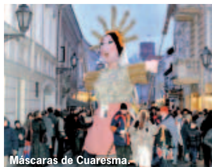
Máscaras de Cuaresma.

A 30 km se encuentra Trakai, la capital medieval del país. Su castillo gótico, que se alza en una de las islas del lago Galve, es uno de sus principales reclamos. Sin embargo,