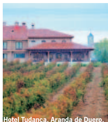
Hotel Tudanca, Aranda de Duero.