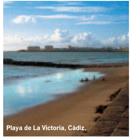
Playa de La Victoria, Cádiz.

En resumen, se trata de un complejo proyecto que pretende crear un diálogo entre Oriente y Occidente a través del arte, la arquitectura y el turismo, según la Autoridad de Turismo y Desarrollo de Abu Dhabi. El desafío último, dicen, es dedicar una aguda mirada al papel global del arte. ■