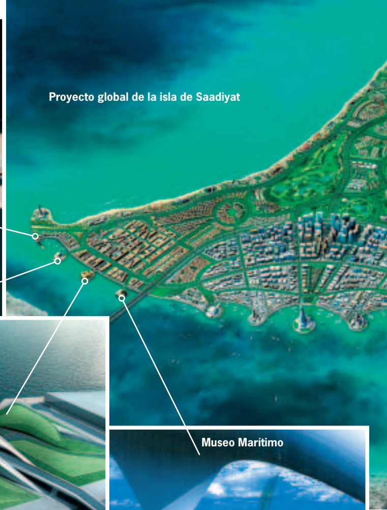
Proyecto global de la isla de Saadiyat