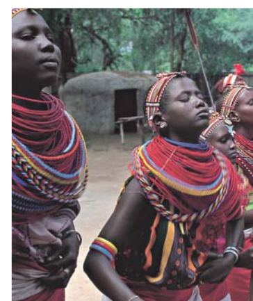
OFICINA DE TURISMO DE KENIA