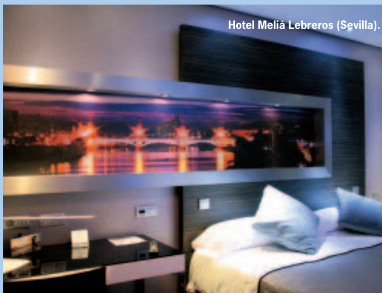
Hotel Meliá Lebreros (Sevilla).