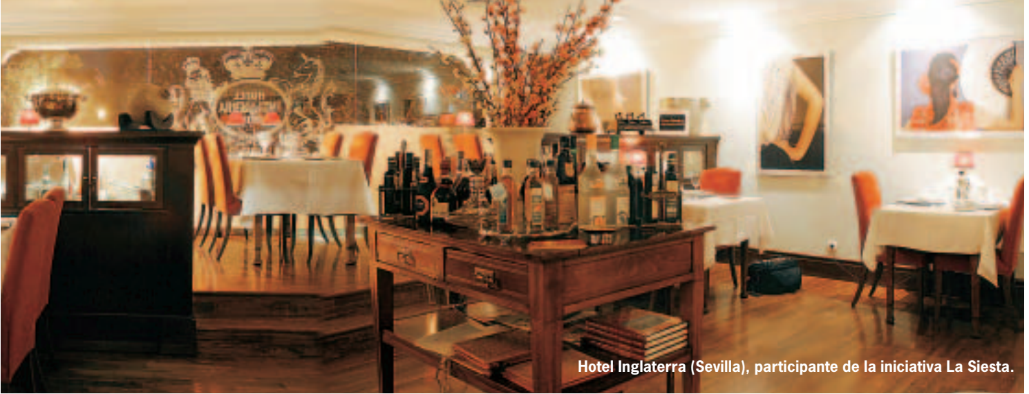
Hotel Inglaterra (Sevilla), participante de la iniciativa La Siesta.

se suele contratar por los canales habituales.