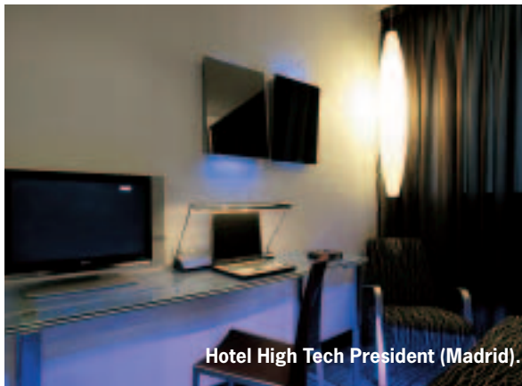
Hotel High Tech President (Madrid).

entre las dos y las seis de la tarde, con la condición de que el cliente hubiera almorzado en el restaurante del hotel. El fenómeno aún es minoritario, pero supone una nueva oportunidad de negocio para los hoteles. Bien lo saben los turistas, los ejecutivos, o pilotos y azafatas. Clientes de esta tendencia que, poco a poco, van generando unos ingresos a los que los hoteleros no tienen por qué renunciar, aunque los beneficios que deje el cliente de paso por el momento estén lejos de ser significativos para las cuentas de los hoteles. ■