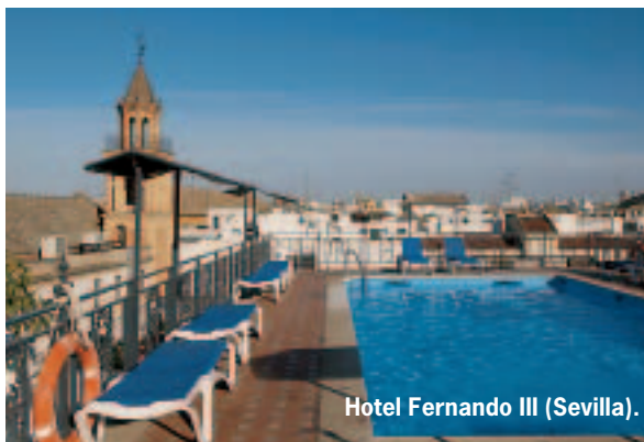
Hotel Fernando III (Sevilla).