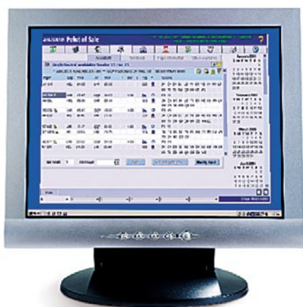
Amadeus Travel Preferences Manager es una herramienta clave a la hora de tratar con clientes corporativos, capaz de ahorrar hasta un 40% del tiempo invertido en realizar las reservas.

Amadeus Rail Interface Record (RVR) tiene características similares, pero ha sido diseñada específicamente para las reservas de tren que se realizan a través del sistema.