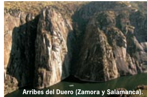
Arribes del Duero (Zamora y Salamanca).