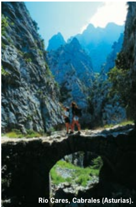
Río Cares, Cabrales (Asturias).