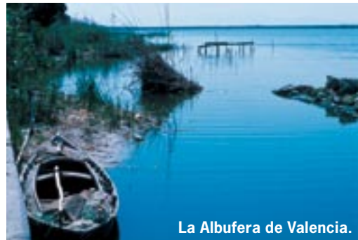
La Albufera de Valencia.

Castilla-La Mancha, los volcanes canarios o la Serranía de Cuenca son otros de los tesoros que se han incluido hasta el momento en la lista. Y espacios como los yacimientos de ámbar de Peñacerrada (Álava), único en el mundo por su antigüedad y calidad de sus fósiles o el de Atapuerca (Burgos), de gran importancia paleontológica, ya tienen una valía y un reconocimiento mundial.