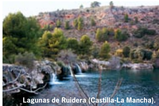
Lagunas de Ruidera (Castilla-La Mancha).