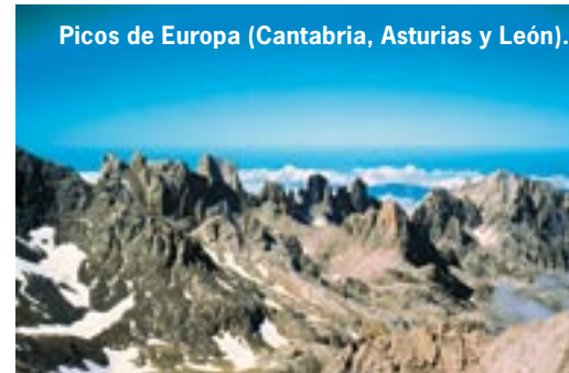
Picos de Europa (Cantabria, Asturias y León).