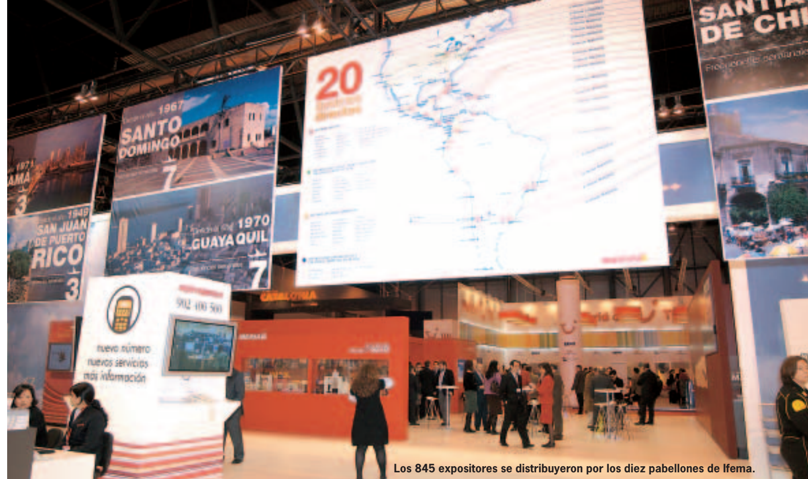
Los 845 expositores se distribuyeron por los diez pabellones de Ifema.

La presencia de Accor en Fitur tiene razón de ser en el incremento sustancial que ha experimentado en el 2006 el número de españoles que viaja al extranjero. Además de ser un mercado emisor que hay que tener presen-