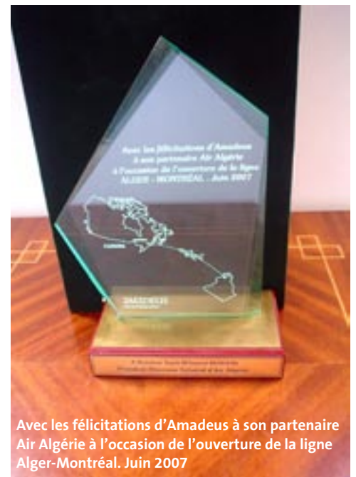
Avec les félicitations d'Amadeus à son partenaire Air Algérie à l'occasion de l'ouverture de la ligne Alger-Montréal. Juin 2007