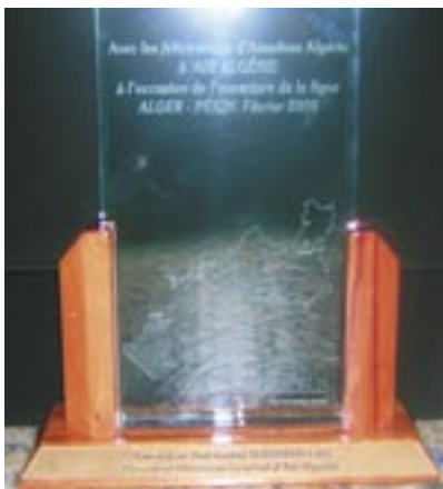
Félicitations d'Amadeus Algérie à sa maison mère à l'occasion de l'ouverture de la ligne Alger-Pékin. Février 2009

L'ouverture de cette ligne long-courrier reliant Alger à la capitale chinoise fait partie des actions stratégiques inscrites dans le plan de développement de l'entreprise. Le vol inaugural s'est effectué depuis l'aéroport international d'Alger le dimanche matin 22 février. Le programme des vols d'Air Algérie à destination de Beijing prévoit deux vols par semaine, les jeudi et dimanche, en Airbus A330/200, d'une capacité de 269 sièges, et assure le retour les vendredi et lundi. Dans une deuxième phase, Air Algérie pourrait étendre sa desserte à Shanghai. Le lancement des vols directs, qui revêt une importance tant pour le gouvernement algérien que pour Air Algérie, ne manquera pas de renforcer la