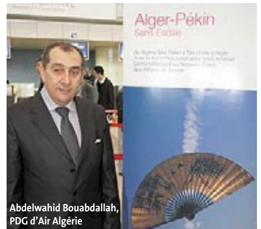
Abdelwahid Bouabdallah, PDG d'Air Algérie

L'ouverture de cette ligne long-courrier reliant Alger à la capitale chinoise fait partie des actions stratégiques inscrites dans le plan de développement de l'entreprise. Le vol inaugural s'est effectué depuis l'aéroport international d'Alger le dimanche matin 22 février. Le programme des vols d'Air Algérie à destination de Beijing prévoit deux vols par semaine, les jeudi et dimanche, en Airbus A330/200, d'une capacité de 269 sièges, et assure le retour les vendredi et lundi. Dans une deuxième phase, Air Algérie pourrait étendre sa desserte à Shanghai. Le lancement des vols directs, qui revêt une importance tant pour le gouvernement algérien que pour Air Algérie, ne manquera pas de renforcer la