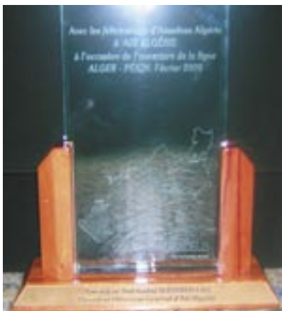
Félicitations d'Amadeus Algérie à sa maison mère à l'occasion de l'ouverture de la ligne Alger-Pékin. Février 2009

L'ouverture de cette ligne long-courrier reliant Alger à la capitale chinoise fait partie des actions stratégiques inscrites dans le plan de développement de l'entreprise. Le vol inaugural s'est effectué depuis l'aéroport international d'Alger le dimanche matin 22 février. Le programme des vols d'Air Algérie à destination de Beijing prévoit deux vols par semaine, les jeudi et dimanche, en Airbus A330/200, d'une capacité de 269 sièges, et assure le retour les vendredi et lundi. Dans une deuxième phase, Air Algérie pourrait étendre sa desserte à Shanghai. Le lancement des vols directs, qui revêt une importance tant pour le gouvernement algérien que pour Air Algérie, ne manquera pas de renforcer la