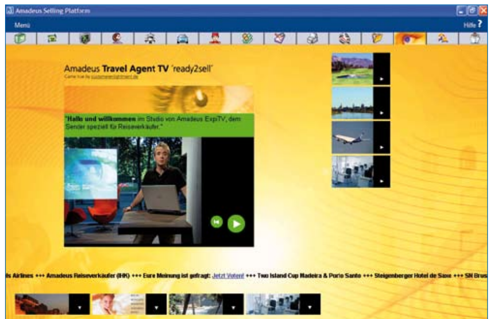
Willkommen bei Amadeus Travel Agent TV „ready2sell“

Reiseverkäufer sind begeistert von Amadeus Travel Agent TV: Die Informationen sind kurz und prägnant, man merkt sie sich besser als lange Texte. Die Beiträge sind informativ und eine echte Verkaufshilfe.