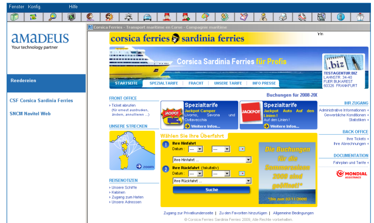
Beispiel 1: B2B-Seite von Corsica Ferries / Sardinia Ferries

Es öffnet sich die B2B-Seite der ausgewählten Reederei.