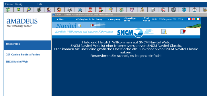
Beispiel 2: B2B-Seite von SNCM